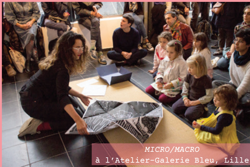
MICRO/MACRO à l'Atelier-Galerie Bleu, Lille