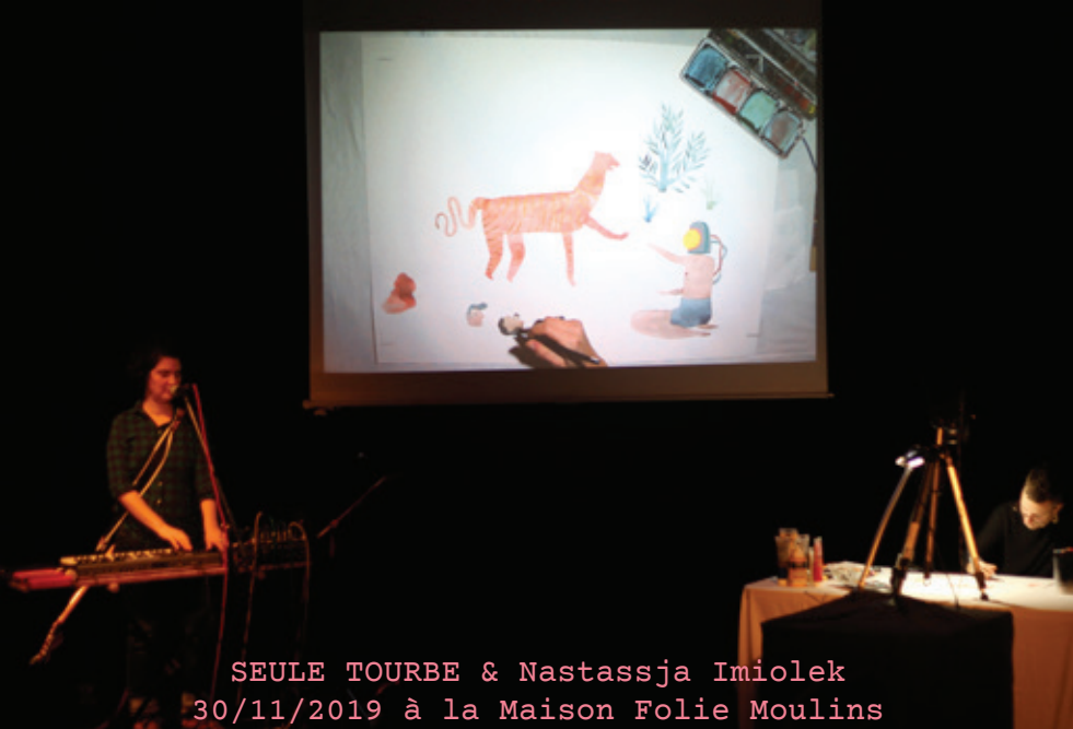
SEULE TOURBE & Nastassja Imiolek 30/11/2019 à la Maison Folie Moulins