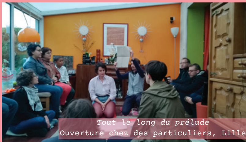
Tout le long du prélude Ouverture chez des particuliers, Lille