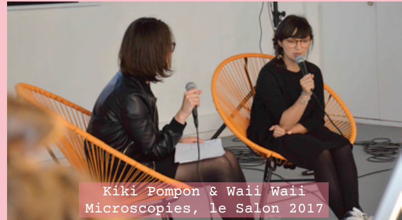
Kiki Pompon & Waii Waii Microscopies, le Salon 2017