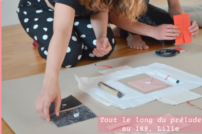
Tout le long du prélude au 188, Lille