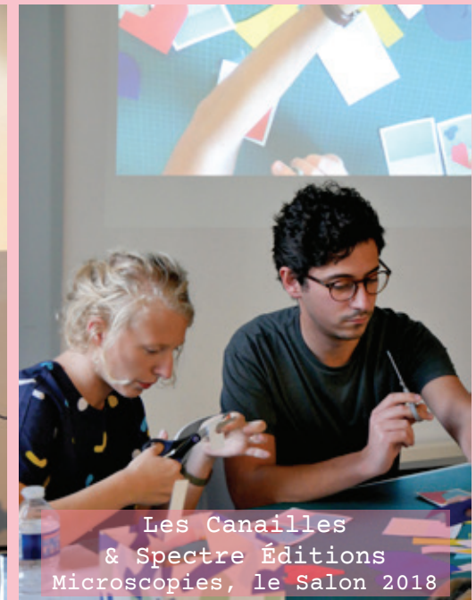
Les Canailles & Spectre Éditions Microscopies, le Salon 2018